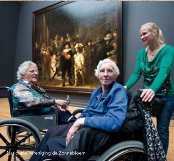
Nationale Vereniging de Zonnebloem