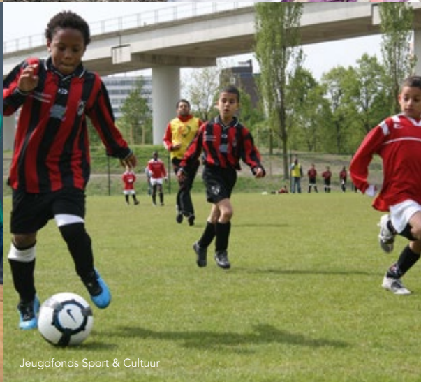
Jeugdfonds Sport & Cultuur